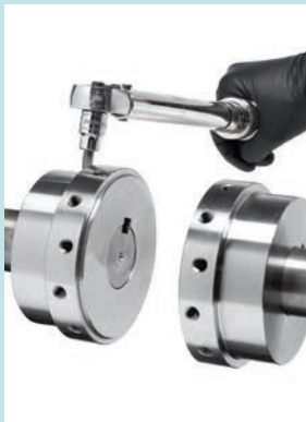
Fase 1 - Installare i mozzi

Installare i giunti Dodge Raptor è semplice e veloce. Grazie all'elemento diviso orizzontalmente in due metà, Raptor non richiede il bloccaggio degli alberi in fase di installazione. L'installazione risulta quindi più rapida, richiedendo meno utensili ed eliminando il rischio di danni all'albero. Basta fissare i mozzi dell'albero, installare l'elemento e serrare i bulloni.