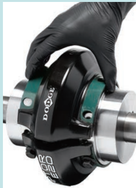
Fase 2 - Regolare la distanza