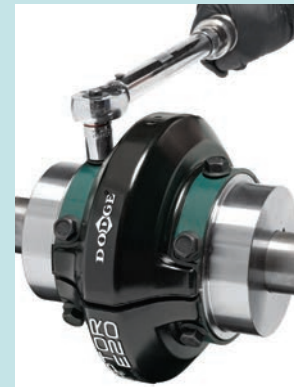
Fase 3 - Installare l'elemento